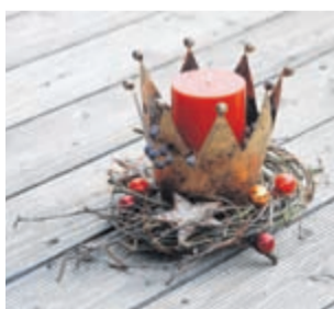
Adventskerze mit Krönchen weihnachtlich verziert