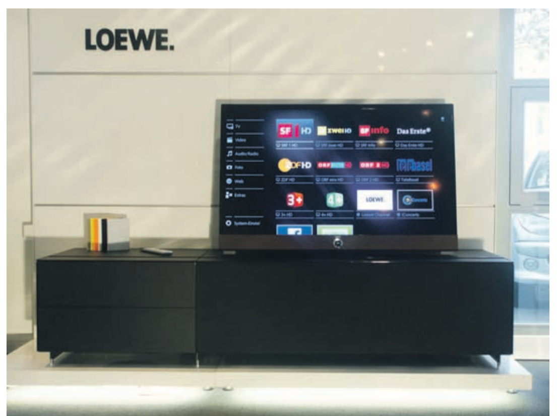
Spectral Möbel Cocoon in schwarz satiniert und Loewe Connect ID schwarz/havana mit integrierter Aufnahmefunktion.

Reinacherstrasse 2, 4106 Therwil Telefon 061 721 64 65, Fax 061 721 65 08 E-Mail: info@fernsehfehr.ch Internet: www.fernsehfehr.ch Kundenparkplätze vorhanden