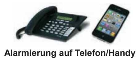
Alarmierung auf Telefon/Handy