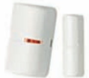
1 Drahtlos Türkontakt