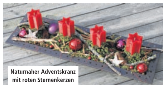
Naturnaher Adventskranz mit roten Sternkerzen

werden staunen und dürfen sich bereits jetzt freuen.