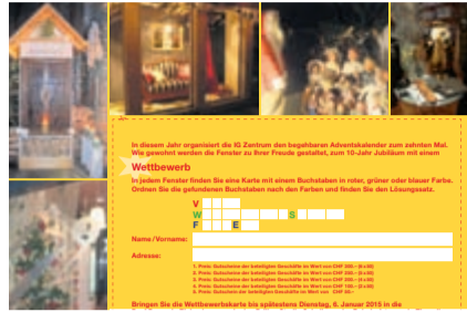
Adventsfeier Therwil mit Wettbewerb Seite 6/7