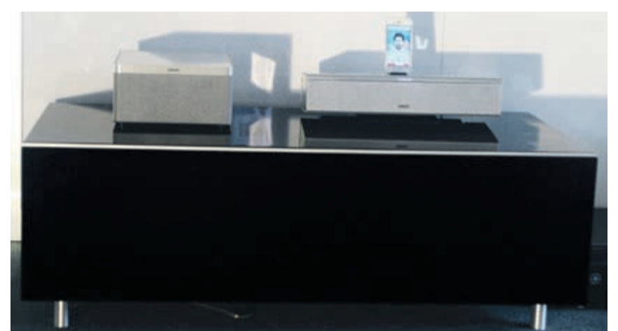
Loewe Airspeaker und der neue Loewe Bluetooth Lautsprecher Sound Port Compact mit Lightning Anschluss.

liert werden. Somit können die Lautsprecher elegant verpackt werden und sind nicht im ganzen Raum verteilt. Heimkino-Atmosphäre ist trotzdem garantiert. Gerne führen wir Ihnen dieses Klangerlebnis bei uns im Laden vor.