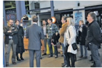
Vereinsausflug Therwil und Ettingen Seite 9

Impressum Erscheinungstag: Donnerstag Auflage: 22.284 Exemplare (Stand 2013) Adresse: Birsigtal-Bote, Missionsstrasse 36 Postfach 393, 4012 Basel Telefon Redaktion: 061 264 64 34 Telefax: 061 264 64 33 E-Mail: redaktion@bibo.ch Verlag: Cratander AG, 4012 Basel Verlagsleitung: Alfred Rüdüsühli Inserate: AZ Anzeiger AG, Tel. 061 706 20 23