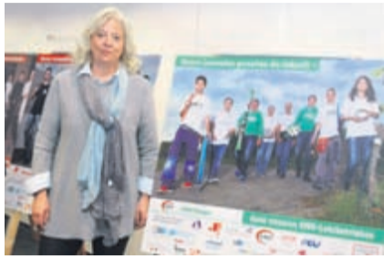
Gewerbe- und Industrievereine (KGIV) Seite 5