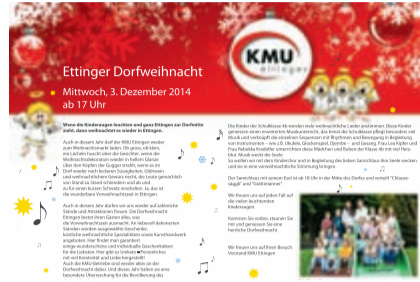
Weihnachtsmärkt Ettingen Seite 9